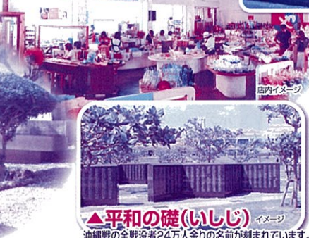
▲平和の礎(いしじ) イメージ

▼琉球ガラス村 沖縄本島の最南部、糸満市にある県内最大の手作りガラス工房です。雨の日でもお楽しみいただける屋内の観光施設も充実!